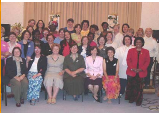
À l'occasion des 100 ans de l'Entente cordiale, le 26 juin 2004, membres et amies du chapitre français de la FFPM ont voyagé à Londres pour y rencontrer des femmes britanniques et célébrer l'amitié franco-britannique en traversant le Pont de la Paix.