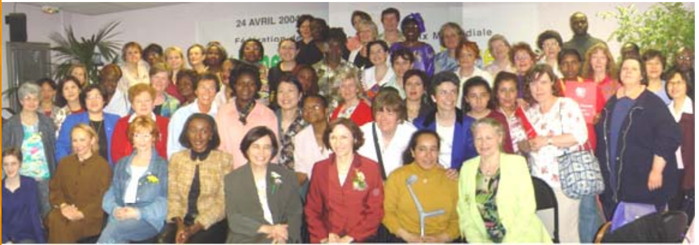
Femmes africaines et françaises, à Paris, le 24 avril 2004