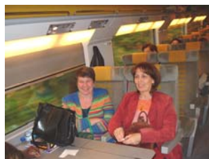
Une visite de Londres en bus et en bateau sur la Tamise, faisait partie du programme.